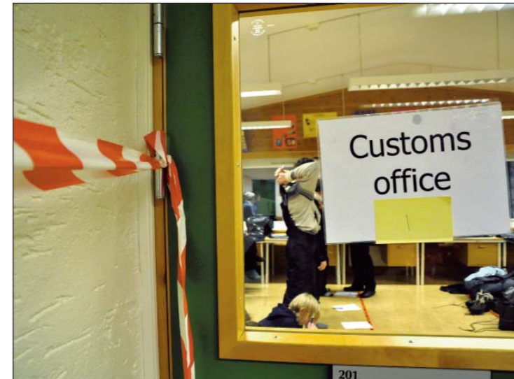
SPERRINGAR: Streng disiplin og vakhald var gjennomgangstonen.

– Det skal vera ganske strengt, jentene får til dømes