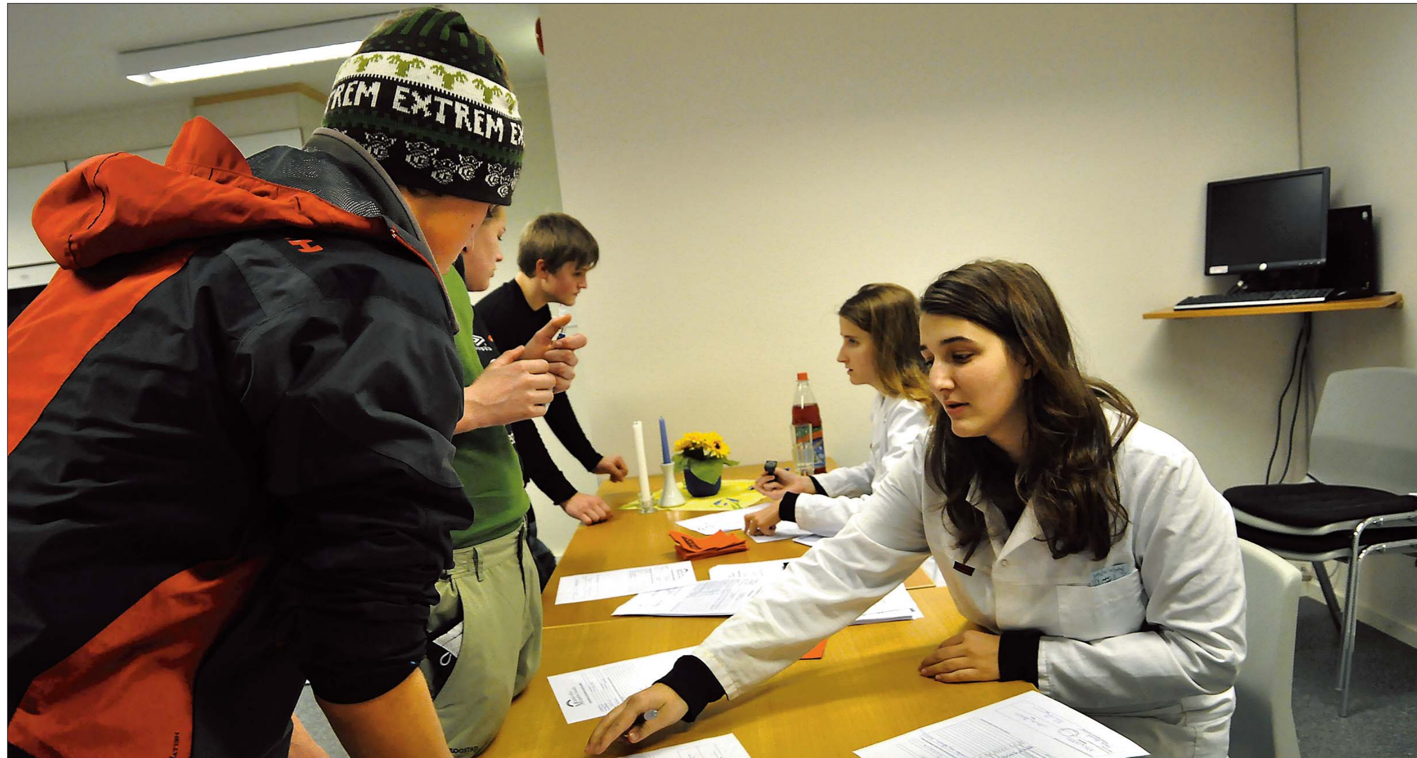
SKJEMAVELDE: Strenge vakter syter for at det skal vera alt anna enn lett å vera på flukt frå Somalia.