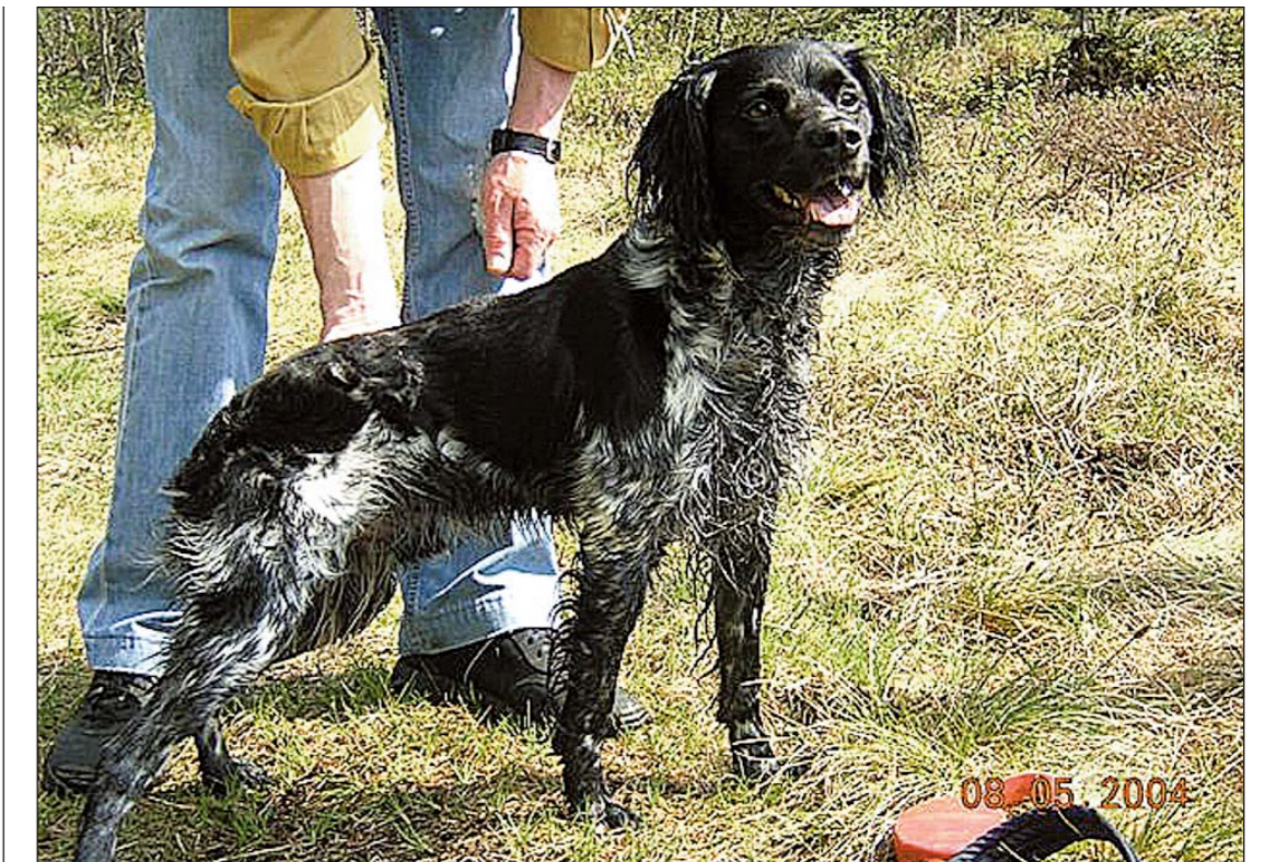
NAUDVERGJE: Norges Jeger- og Fiskeforbund krev naudvergerett for hund i område med ulv. (Illustrasjonsfoto)