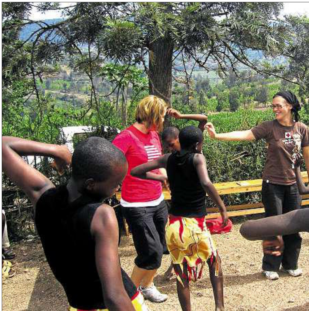
Camilla fikk være med på tradisjonell rwandisk dans da hun besøkte en organisasjon som jobber for å støtte barn i vanskelige situasjoner.

kjøpt meg leilighet og jobbet i et vikariat i Oslo kommune. Men jeg visste at jeg ville angre om jeg ikke tok sjansen, sier hun.