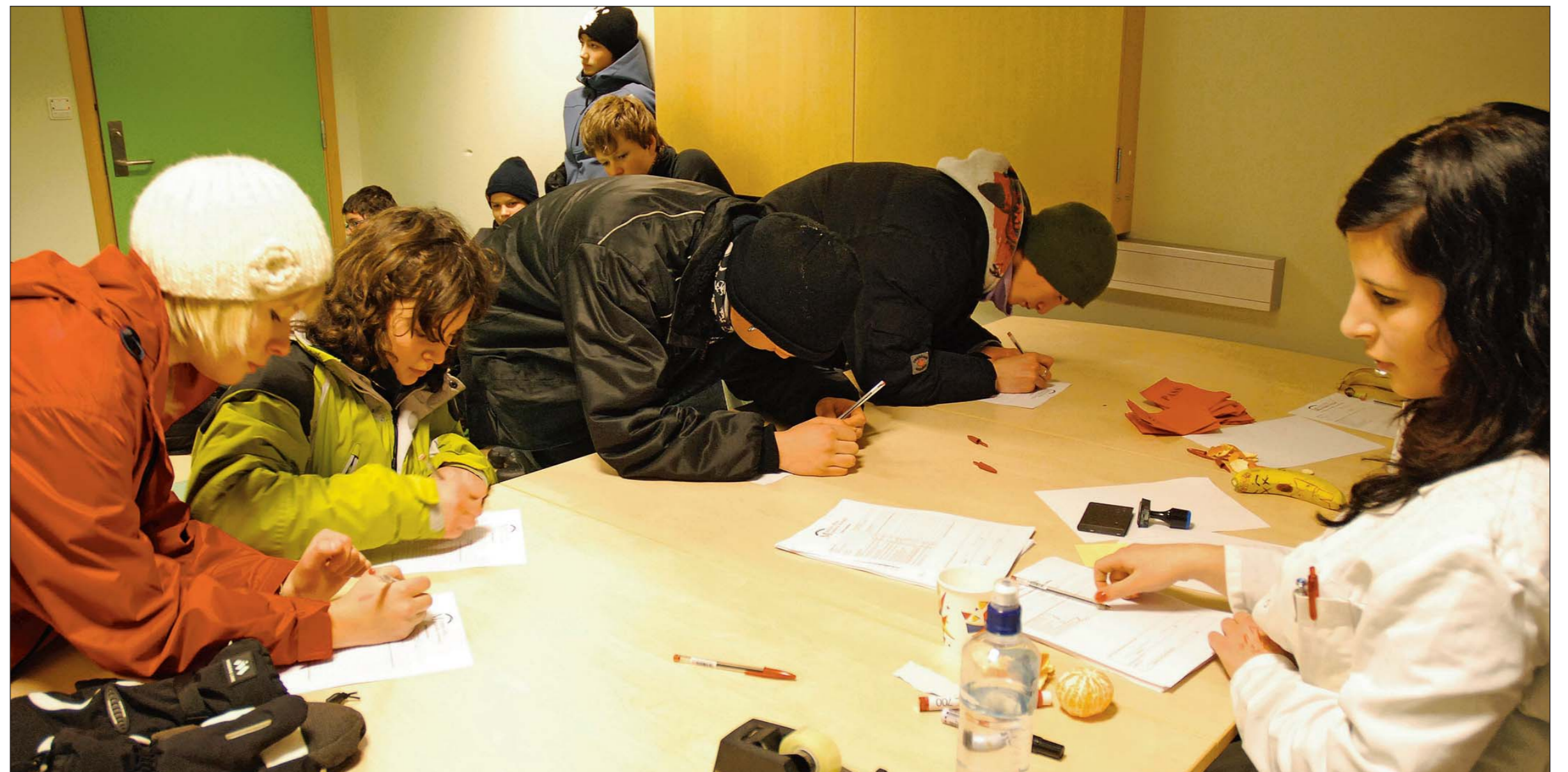
SKJEMA-VELDE: I rollespelet «På flukt» spelar ungdommane flyktingar frå Somalia. Ungdommane møter skjemavelde, strenge grensevakter og må gjennom ein liten helsesjekk.

Det er Røde Kors som arrangerer desse rollespela, og i dette tilfellet er dei bestilt av Human-Etisk Forbund. Røde