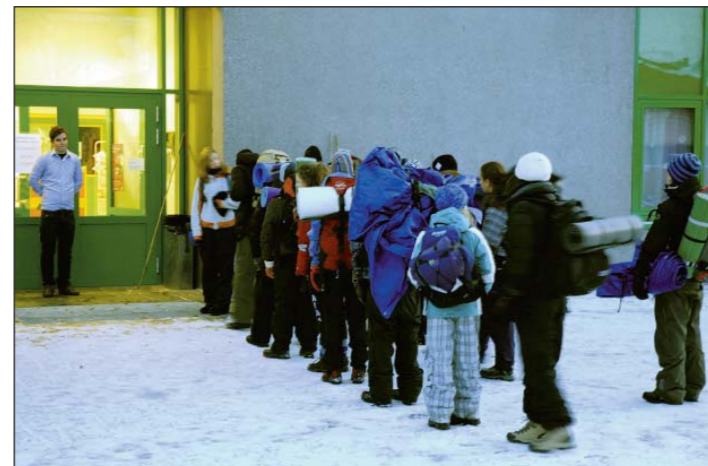
KALDT: Ungdommane var på flukt i fleire timar på Hafslo laurdag, i opp mot åtte-ni kuldegrader. Her ventar dei på å koma inn på flyktningekontoret på Luster vidaregåande skule

Spelte somaliske flyktingar Røde Kors arrangerer