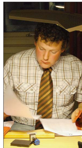
ALT I ORDEN: Når ein representant for pressa er på besøk, får denne kontorfullmektigen opp effektiviteten og ingenting mistenkeleg føregår. Røde Kors stiller med instruktørane til rollespelet.