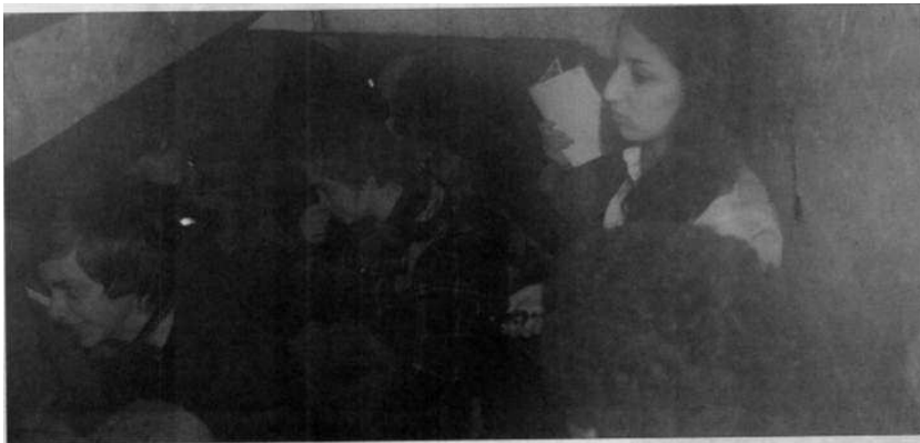
DE BORGERLIGE konfirmantene opplever døgnet i rollespillet som krevende og tøft