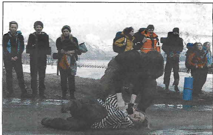
Realistiske scener. Her med profesjonelle instruktører i rollene.

forskjell til det bedre i samfunnet. Dette er en måte å gjøre det på, sier han.