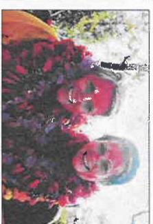
Engasjerte frivillige på markering av Verdens Aids Dag

av Mount Everest. Heldigvis har jeg noen måneder igjen før jeg vender nesens nok Norge og Sotra igjen. Tilbake til en mer forutsigbar hverdag hvor man kan drikke vann fra springen alltid har strømm, husene er varme selv om det er kaldt ute, og man kan trygt holde øynene åpne når man stier på med noen i trafikken.