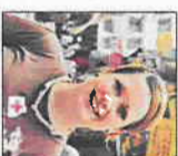
Skrevet av Marina Magerøy, Ungdomsdelegat i Nepal