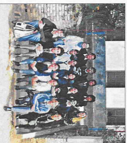
Sammen med en nyopprettet ungdomsgruppe

I en av landsbyene i distriktet jeg jobber,