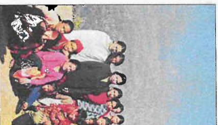
Møte med en kvinnegruppe i en fjell landsby

I tillegg til jobb er det flere turistssteder som skal besøkes, og jeg håper å få en litt