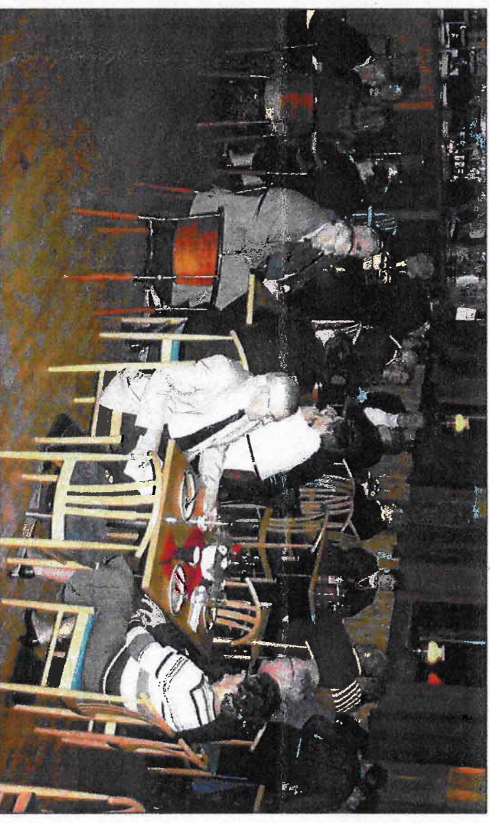
Omlag 60 deltakere var med på medlemsfesten