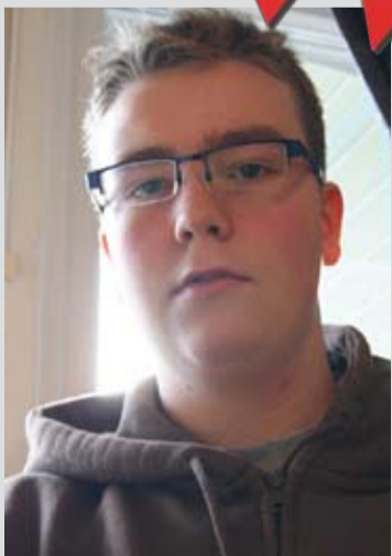
Jørgen Fjeldberg.