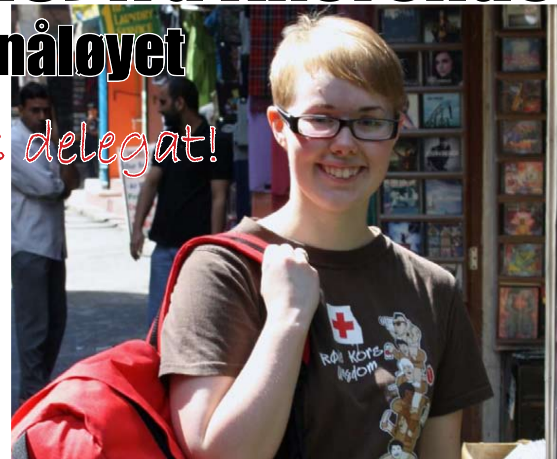
Cathrine Hårsaker.

Noe av det har jeg drevet med før, noe er nytt – heldigvis! Å bli ungdomsdelegat har vært noe jeg har hatt lyst til siden jeg begynte som