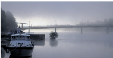
MORGENSTEMNING. Tidlig augustmorgen ved Drammenselva.